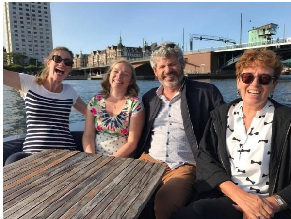
COLLOQUE ECER 2017 COPENHAGUE