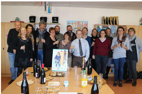
CONGRES TACD 2019