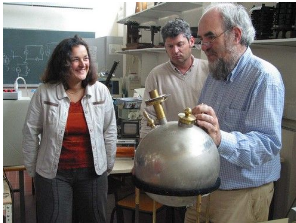
Udppc -Visite des collections Rennes 1-2006 RENNES 2017