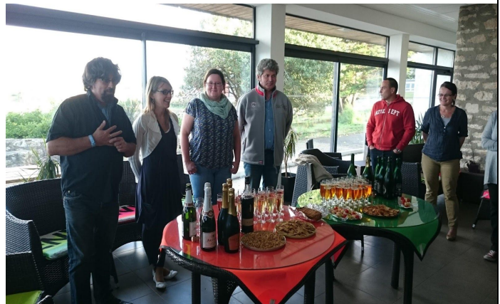
Rentrée du CREAD 2015