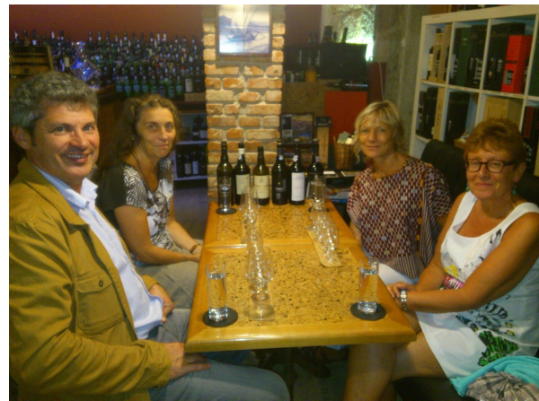
COLLOQUE ECER 2014, PORTO